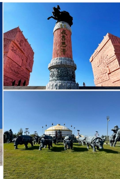
เขตท่องเที่ยวเจงกิสข่าน • กลุ่มประติมากรรม กองทัพเหล็กและกระโจมทอง