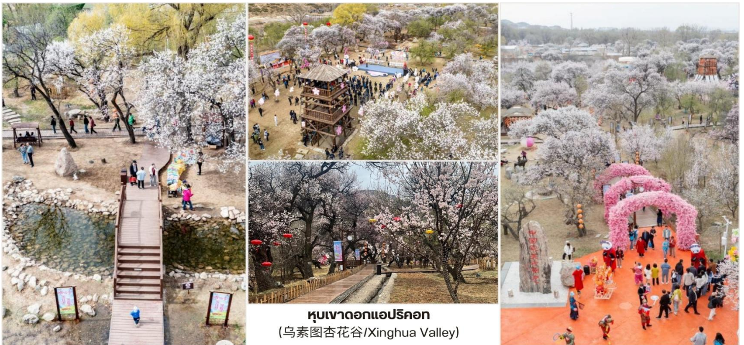
หุบเขาดอกแอปริคอต (乌素图杏花谷/Xinghua Valley)

บ่าย นำท่านชม หุบเขาดอกแอปริคอต (乌素图杏花谷/Xinghua Valley) หรือ "ชิงฮวาถู" เป็นหุบเขา ที่พื้นที่บริเวณดังกล่าวเต็มไปด้วยต้นแอปริคอต และเมื่อคราวใดก็ตามถึงช่วงเวลาที่ดอกแอปริคอตเบ่งบาน หุบเขาแห่งนี้จะถูกปกคลุมไปด้วยสีชมพูแสนหวาน จนทำให้สถานที่แห่งนี้เป็นหนึ่งในแลนด์มาร์กดึงดูดนักท่องเที่ยวให้ เดินทางไปชมภูเขาสีชมพูด้วยตาตัวเอง