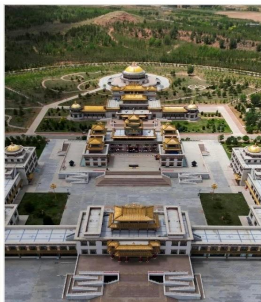
ทำเนียบพระลามะอุหลาน