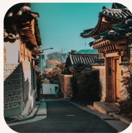
Bukchon Hanok Village หมู่บ้านฮอกซอนอันอก