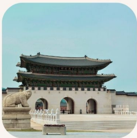
Gyeongbokgung Palace พระราชวังคยองบกกุง