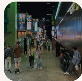
Myeongdong แหล่งช้อปปิ้ง + สกินแคร์แน่นมาก