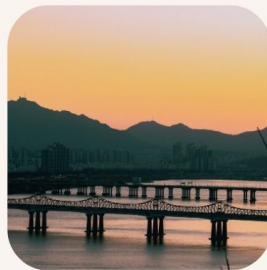
Banpo Bridge น้ำพุสายรุ้ง