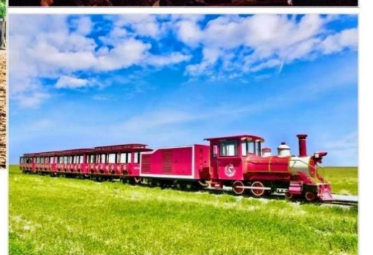
OPTION TOUR.. กิจกรรมทุ่งหญ้าออร์ดอส (Ordos Prairie)