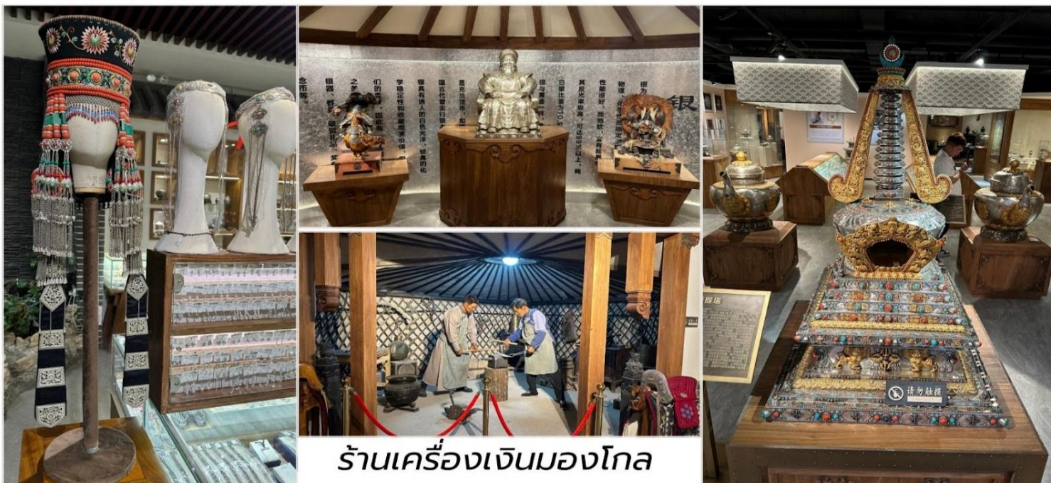
ร้านเครื่องเงินมองโกล

เช้า บริการอาหารเช้า ณ ห้องอาหารของโรงแรม นำท่านชม ร้านเครื่องเงินมองโกล ชมงานศิลปะการทำเครื่องเงินโบราณ ที่สืบทอดจากชนเผ่ามองโกล รุ่นสู่รุ่น ช่างฝีมือจะใช้เทคนิคดั้งเดิมในการขึ้นลายเงินอย่างประณีต ทั้งเครื่องประดับ, เข็มขัด, และของใช้พิธีกรรม – สะท้อนอัตลักษณ์ท้องถิ่นได้อย่างทรงคุณค่า นำท่านเดินทางสู่ทุ่งหญ้าออร์ดอส ใช้เวลาเดินทางประมาณ 2 ชั่วโมง