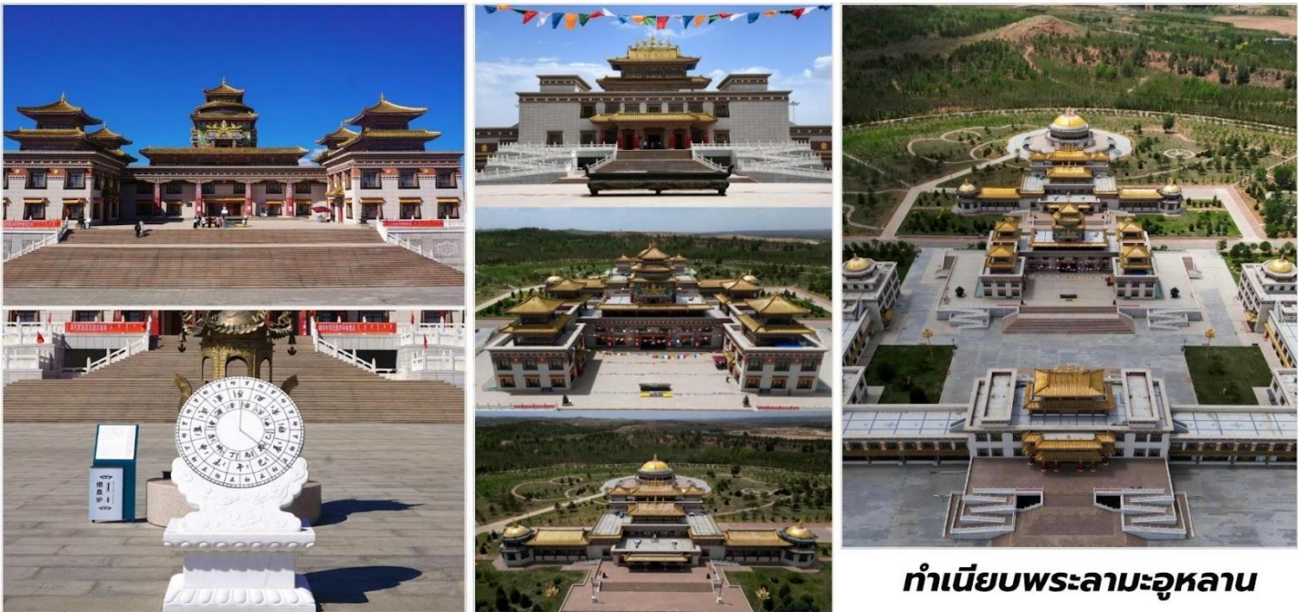
ทำเนียบพระลามะอุหลาน

บ่าย จากนั้นนำท่านชม ทำเนียบพระลามะอุหลาน (Ulan Living Buddha Mansion, 乌兰活佛府) เป็น ศาสนสถานอันศักดิ์สิทธิ์ แต่ยังเป็นเสมือนพิพิธภัณฑ์มีชีวิตที่บอกเล่าเรื่องราวของพระพุทธรูปศาสนาทิเบตที่ยิ่ง รากลึกในวัฒนธรรมมองโกล ทำเนียบพระลามะอุหลาน สร้างขึ้นเพื่อเป็นที่ประทับและศูนย์กลางการเผยแผ่ ธรรมของ พระลามะอุหลาน ซึ่งเป็น พระลามะที่มีความสำคัญยิ่งต่อศรัทธาและความเชื่อของชาวมองโกลในภูมิภาคนี้ การมาเยือน ที่นี้จึงไม่ใช่แค่การเที่ยวชมอาคาร แต่เป็นการเดินทางสู่โลกแห่งความสงบ ศรัทธาและประวัติศาสตร์ ตื่นตาตื่นใจกับ สถาปัตยกรรมที่วิจิตรตระการตา ซึ่งเป็นการผสมผสานอย่างลงตัวระหว่างศิลปะแบบมองโกล อันและ ทิเบต อาคารสูง ตระหง่าน หลังคาสีสันสดใส รายละเอียดการแกะสลักและการตกแต่งที่ประณีต ล้วนสะท้อนถึงความ รุ่มรวยทางศิลปะ และวัฒนธรรมอันเป็นเอกลักษณ์