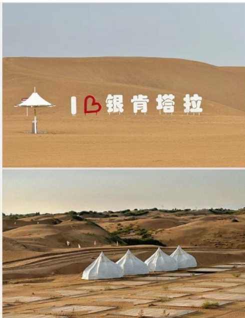
ทะเลทรายอินเคินทาลา (银肯塔拉沙漠 / Yinkentala Desert)