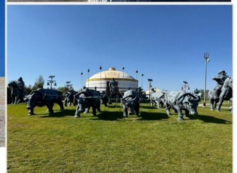
เขตท่องเที่ยวเจงกิสข่าน • กลุ่มประติมากรรม กองทัพเหล็กและกระโจมทอง

จากนั้นนำท่านตามรอยเท้าของมหาบุรุษผู้ยิ่งใหญ่ "เจงกิสข่าน" (Genghis Khan) นำท่านชม เขตท่องเที่ยวเจงกิสข่าน (Genghis Khan Tourist Area, 成吉思汗旅游区) ซึ่งเป็นสถานที่สำคัญทางประวัติศาสตร์และวัฒนธรรมที่ตั้งอยู่ในเมืองเอ้อเอ๋อร์ตัวซือ (Ordos) เขตปกครองตนเองมองโกเลียในประเทศจีน ที่นี่ไม่เพียงเป็นสถานที่รำลึกถึงเจงกิสข่าน แต่ยังเป็นศูนย์รวมประสบการณ์ที่จะพาคุณย้อนเวลากลับไปสู่ยุคเรืองรองของชนเผ่า