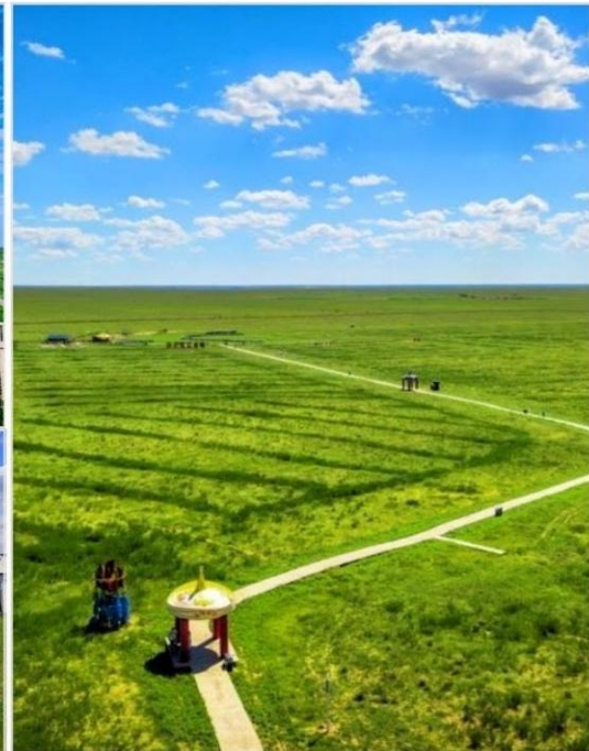
ทุ่งหญ้าออร์ดอส (Ordos Prairie)

วันที่สาม ชมพระอาทิตย์ขึ้นที่ทุ่งหญ้า-ลองชิมอาหารเช้าแบบมองโกล-เขตท่องเที่ยวเจงกิสข่าน-ทำเนียบพระลามะอุหลาน-ตลาดตอนกลางคืนเมืองตาลาเต๋อ