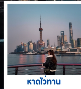
ทาดไวทาน