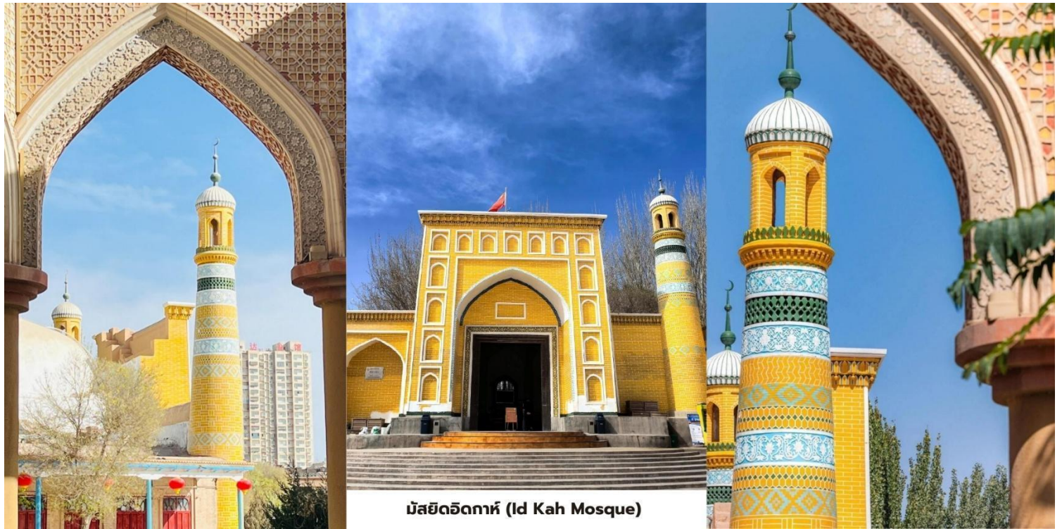
มัสยิดอิตก้าห์ (Id Kah Mosque)

สมควรแก่เวลานำท่านเดินทางสู่สนามบินคาสการ์ (Kashgar Airport) ภายในประเทศสู่เมืองหลานโจว