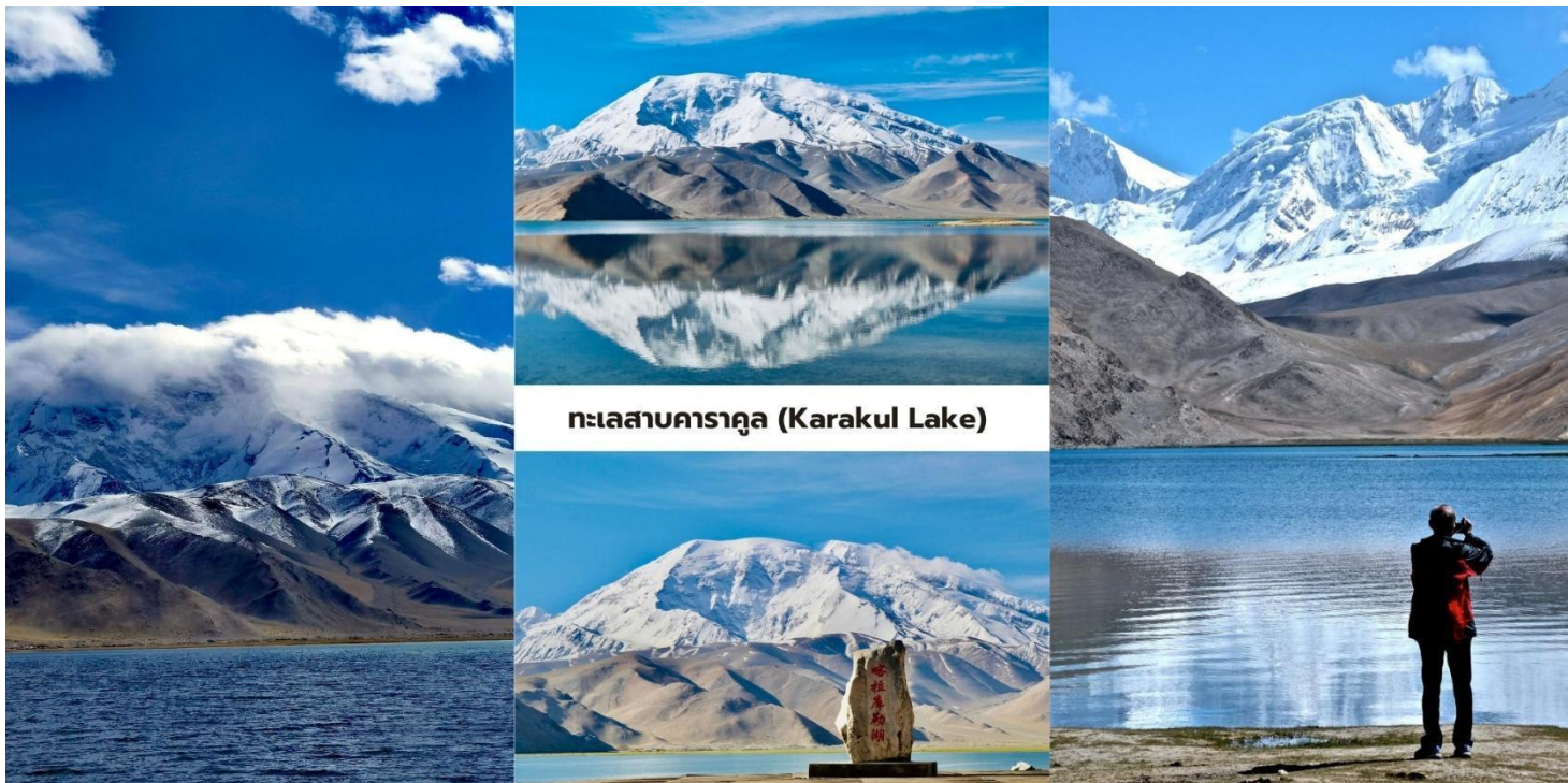
ทะเลสาบคาราคูล (Karakul Lake)

นำท่านแวะชม หนองน้ำดำเหอมา่น (Taheman Wetland/Taxkorgan Wetland) พื้นที่ชุ่มน้ำธรรมชาติบน ที่ราบสูงปามีร์ ซึ่งมีทุ่งหญ้าและลำธารกระจายตัวอยู่ทั่วบริเวณ พื้นที่แห่งนี้เป็น แหล่งอาศัยของนกอพยพและสัตว์ป่านานาชนิด โดยเฉพาะในช่วงฤดูใบไม้ผลิและฤดูร้อนสามารถพบนกหลายชนิด เช่น นกกระเรียน นกฟลามิงโก และนกเป็ดหลากสายพันธุ์ เป็นต้น ในส่วนของบริเวณทิวทัศน์ของพื้นที่ชุ่มน้ำแห่งนี้โดดเด่นด้วย แม่น้ำที่คดเคี้ยวผ่านทุ่งหญ้าสีเขียว โดยมีฉากหลังเป็นภูเขาหิมะแห่งเทือกเขาปามีร์สร้างภาพธรรมชาติที่แตกต่างจากภูเขาหินที่แห้งแล้งของภูมิภาคโดยรอบ