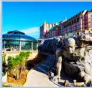
Tou Eclipse Square