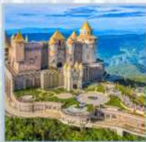
ปราสาทจันทร