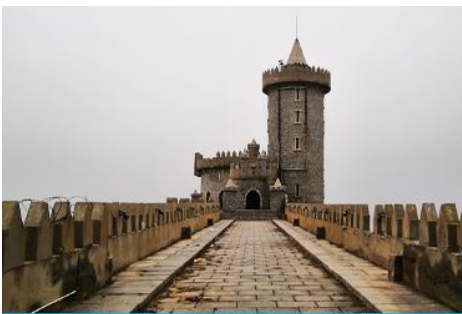
คาเฟ่อีสดง