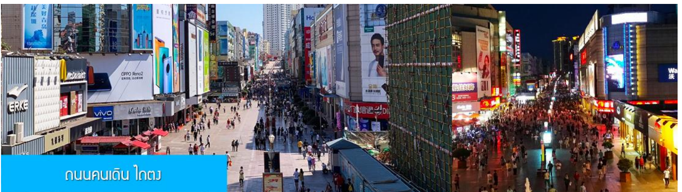
ถนนคนเดิน ไถตง

จากนั้นนำท่านเที่ยวชม โรงเบียร์ชิงเต่า 青岛啤酒博物馆 พิพิธภัณฑ์เบียร์ที่ขึ้นชื่อของเมืองชิงเต่า ซึ่งเป็นเบียร์ยี่ห้อแรกที่ผลิตขึ้นในประเทศจีน ชมเบียร์ คอลเลกชันที่มียี่ห้อหลากหลายที่สุดของโลก และชมการจัดแสดงภาพและวิดิทัศน์เกี่ยวกับวิวัฒนาการของเบียร์ ขั้นตอนการผลิตและอื่น ๆ ที่เกี่ยวข้อง พร้อมชิมเบียร์ชิงเต่า ซึ่งเป็นเบียร์ที่ขายดีที่สุดยี่ห้อหนึ่งของจีน.. (ชิมเบียร์ชิงเต่าท่านละ 1 แก้ว รับกลับอีก 1 ขวดเล็ก ตอนเดินออก)