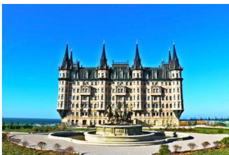
คฤหาสน์เหวินเจิง

นำท่านไปเยือนเมืองท่าสุดโรแมนติคสไตล์ยุโรป ท่าเรือชาวประมง ให้ท่านได้ชมสถาปัตยกรรมสไตล์อเมริกาเหนือ และ ยุโรป ที่ตั้งอยู่ในผืนแผ่นดินจีน ณ เมืองเยียนไถ เก็บบรรยากาศลมทะเล และเก็บรูปกับอาคารหลังคาสี่เสดเป็นฉากหลัง ที่เต็มไปด้วยมนต์เสน่ห์และความทรงจำที่สวยงาม ให้ท่านเก็บภาพความสวย