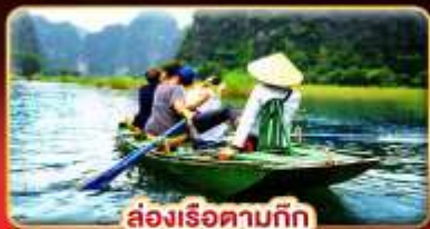
ล่องเรือตามก๊ก