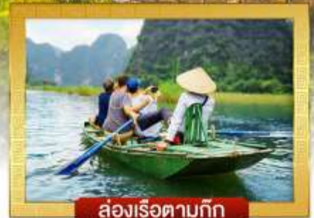
ล่องเรือตามก๊ก