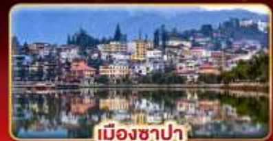
เมืองซาปา