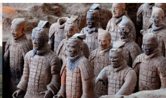
สุสานทหารจีนซี