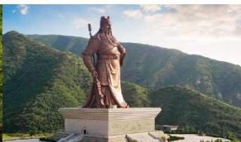
บ้านเกิดกวนอู