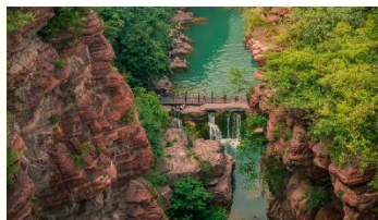
อุทยานสวรรค์หยุนโตซาน