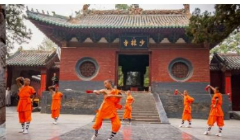
ชมโชว์กังฟูเส้าหลิน

*ทางบริษัทฯ ขอสงวนสิทธิ์ในการสลับโปรแกรมทัวร์ตามความเหมาะสมขึ้นอยู่กับสถานการณ์หน้างาน โดยคำนึงถึงผลประโยชน์ของลูกค้าเป็นสำคัญ