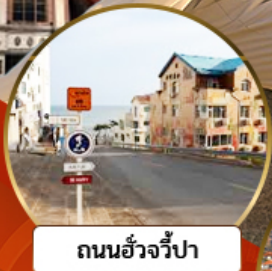
ถนนฮ้าวจี้ปา