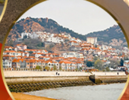
ซาจื่อเป่