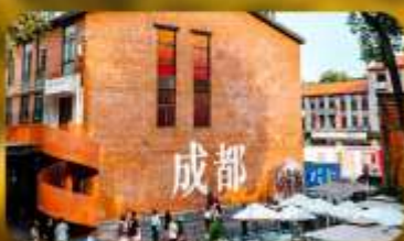
ตงเจียวจี้

HOLIDAY INN EXPRESS HOTEL หรือเทียบเท่า 4 ดาว