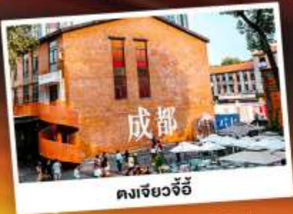
ตงเจียวจี้

เทือกเขาแอลป์แห่งเมืองจีน ชมความงามของ "อุทยานภูเขาสิ่วครุณี"