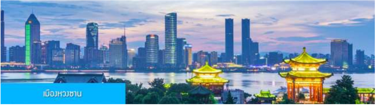
เมืองหวงซาน