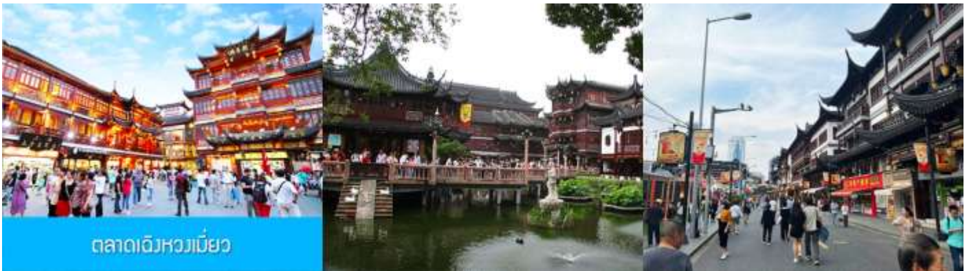
ตลาดเจิงหวงเมี่ยว

เช้า รับประทานอาหารเช้า ณ ห้องอาหารของโรงแรม (6)