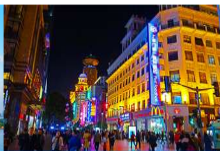
ถนนคนเดินหนานจิงลุ่