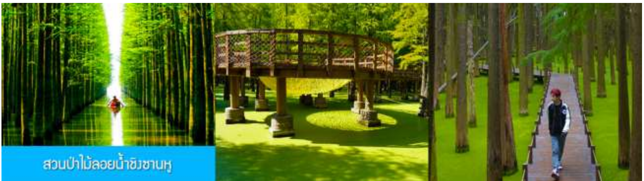
สวนป่าไม้ลอยน้ำชิงชานหู

หลังอาหารเช้าท่านเดินทางโดยรถบัสสู่เมืองหลิงอัน 临安市 (ระยะทาง 175 กม. ใช้เวลาเดินทางราว 2 ชั่วโมงเศษ)