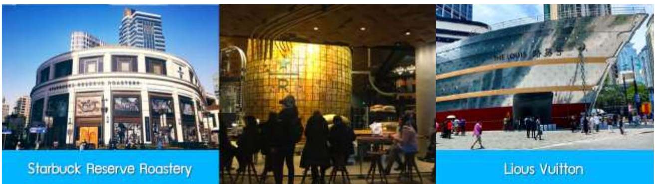
Starbuck Reserve Roastery