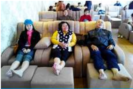
ศูนย์วิจัยแพทยแผนจีน