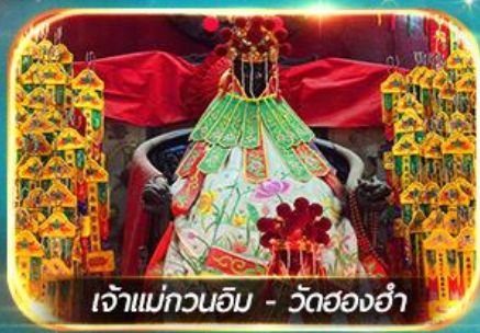
เจ้าแม่กวนอิม - วัดสองอ่า