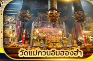
วัดแม่กวนอิมฮ่องฮ่า