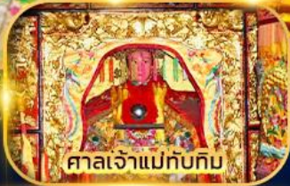
ศาลเจ้าแม่ทับทิม