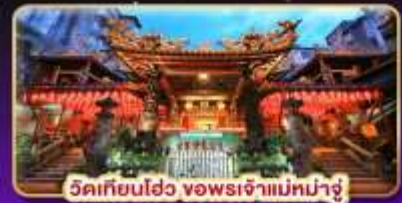
วัดเทียนเฮว จอพระเจ้าแม่หม่าจู