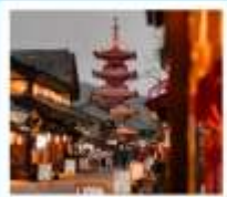
หมู่บ้านเหมียนฮวาวาน