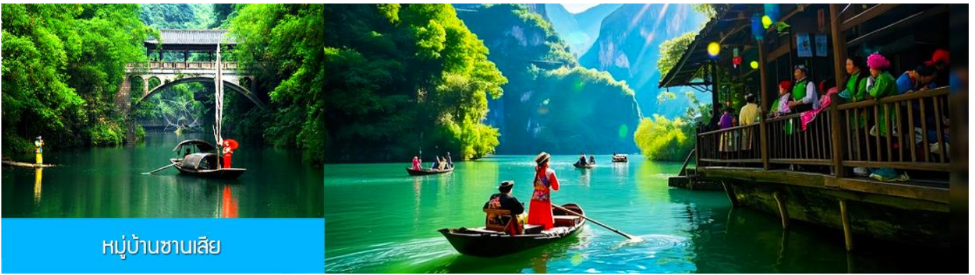
หมู่บ้านชาวลี