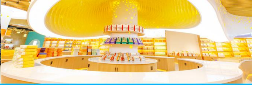
พิพิธภัณฑ์ดอกกุยฮวา

จากนั้นนำท่านเที่ยวชม พิพิธภัณฑ์ดอกกุยฮวา 桂花公社 ดอกกุยฮวาเป็นดอกไม้สีเหลืองที่มีกลิ่นหอม เป็นดอกไม้ประจำเมืองของกุยหลิน จะเบ่งบานในช่วงเดือนมิถุนายน – กรกฎาคมของทุกปี ในช่วงที่ดอกกุยฮวาเบ่งบานในเมืองกุยหลินจะคลุ้งไปด้วยกลิ่นหอมจากดอกกุยฮวา ทั่วเมืองกุยหลินจะเต็มไปด้วยสีเหลืองของดอกกุยฮวา ดอกกุยฮวาสามารถนำมาแปรรูปเป็นอาหารและเครื่องดื่มได้ และได้รับความนิยมจากชาวจีนตอนใต้เป็นอย่างมาก ชมพิพิธภัณฑ์ที่ทันสมัยด้วยระบบจัดแสดงที่ทันสมัย ภายในพิพิธภัณฑ์มีความโอ้อ่า มีการสาธิตและจำหน่ายผลิตภัณฑ์ที่ทำจากดอกกุยฮวา อาทิ ขนมดอกกุยฮวา ชาที่ทำจากดอกกุยฮวา และสินค้าพื้นเมืองอื่น ๆ