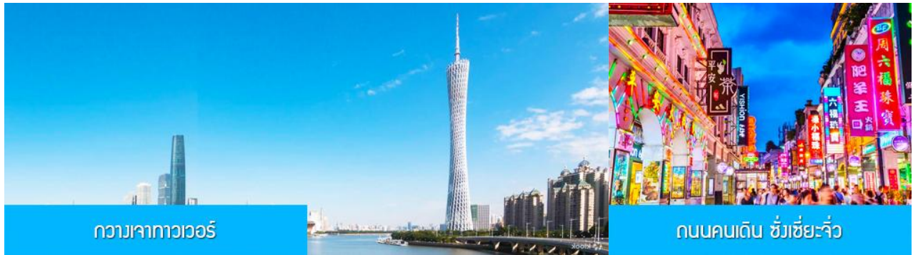
กวางเจาทาวเวอร์