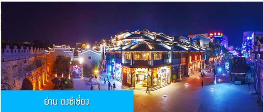
ย่าน ตงซีเจียง

จากนั้นนำท่านเที่ยวชม พิพิธภัณฑ์ดอกกุยฮวา 桂花公社 ดอกกุยฮวาเป็นดอกไม้สีเหลืองที่มีกลิ่นหอม เป็นดอกไม้ประจำเมืองของกุยหลิน จะเบ่งบานในช่วงเดือนมิถุนายน – กรกฎาคมของทุกปี ในช่วงที่ดอกกุยฮวาเบ่งบานในเมืองกุยหลินจะคลุ้งไปด้วยกลิ่นหอมจากดอกกุยฮวา ทั่วเมืองกุยหลินจะเต็มไปด้วยสีเหลืองของดอกกุยฮวา ดอกกุยฮวาสามารถนำมาแปรรูปเป็นอาหารและเครื่องดื่มได้ และได้รับความนิยมจากชาวจีนตอนใต้เป็นอย่างมาก ชมพิพิธภัณฑ์ที่ทันสมัยด้วยระบบจัดแสดงที่ทันสมัย ภายในพิพิธภัณฑ์มีความโอ้อ่า มีการสาธิตและจำหน่ายผลิตภัณฑ์ที่ทำจากดอกกุยฮวา อาทิ ขนมดอกกุยฮวา ชาที่ทำจากดอกกุยฮวา และสินค้าพื้นเมืองอื่น ๆ