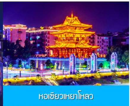
หอชิวเหยาไหล