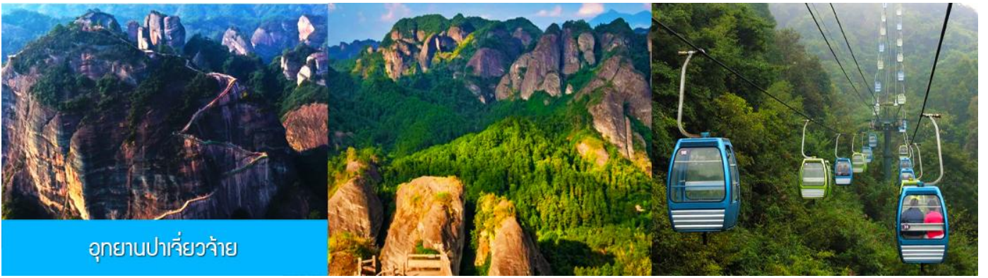
อุทยานปาเจียวจ้าย

หลังอาหารนำท่านเที่ยวชม อุทยานปาเจียวจ้าย 黄山八角寨 อุทยานท่องเที่ยวทางธรรมชาติแห่งนี้ ตั้งอยู่บริเวณรอยต่อระหว่างเขตเมืองกุ้ยหลินและมณฑลหูหนาน ประกอบด้วยยอดเขา(หินปูน)ใหญ่รวมแปดยอด มีหกยอดเขาอยู่ในเขตมณฑลหูหนาน ส่วนที่เหลืออีกสองยอดเขาอยู่ในเขตเมืองกุ้ยหลิน มียอดเขาลังซานเป็นยอดเขาหลักที่มีความสูง 818 เมตร มองแต่ไกลดูราวกับหัวมังกรที่ขีดหัวชี้ฟ้า อันเป็นที่มาของคำว่า ปาเจียวจ้าย (แปลว่า ขุนเขา เขาแปดแท่งหรือเขามังกรแปดหัว).....นำท่านนั่งกระเช้า (ค่าตั๋วรวมค่ากระเช้าขาขึ้นและขาลงแล้ว) ขึ้นสู่จุดชมวิวยบนยอดเขา จากนั้นนำท่านเดินไปตามระเบียงชมวิวเพื่อเที่ยวชมจุดชมวิวต่าง ๆ บนยอดเขา อาทิ จุดชมทะเลหมอก จุดชมปลาวาฬพลิกตัว กองทัพหอยค่านับฟ้า ฯลฯ และนำท่านสักการะสิ่งศักดิ์สิทธิ์ ณ วัดหยุน ไถชื่อวัดเก่าแก่อายุหลายร้อยปีที่ตั้งโดดเด่นอยู่บนยอดเขา.....เมื่อครบถ้วนแล้ว นำท่านนั่งกระเช้าลงจากยอดเขา