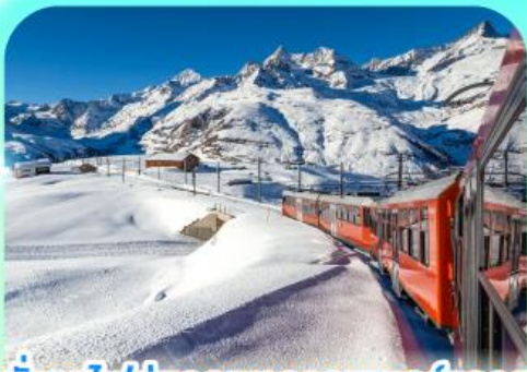
นั่งรถไฟสู่อยอดเขากรอนเนอร์เกรต