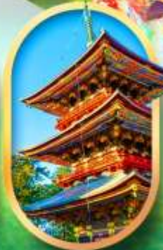
วัดนาริตะ-ซัง