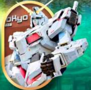
ห้างโอโดบะกินคิม