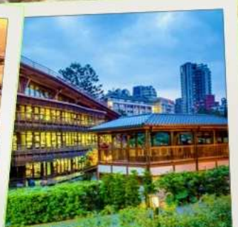
ห้องสมุดเป่ย์โถว