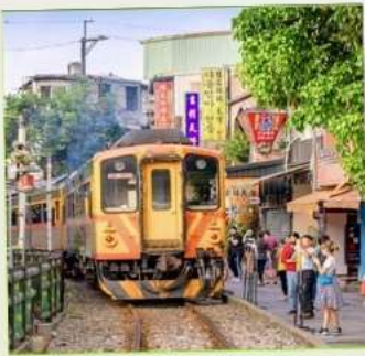
สถานีรถไฟสี่เฟิ่น