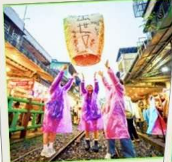
ปล่อยโคมลอย