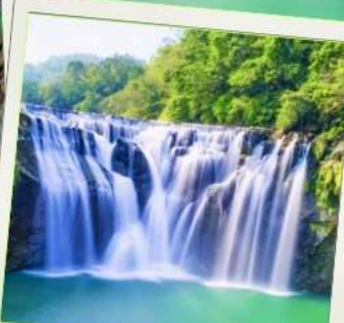
น้ำตกสี่เฟิ่น