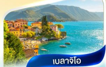
เบลลาจีโอ