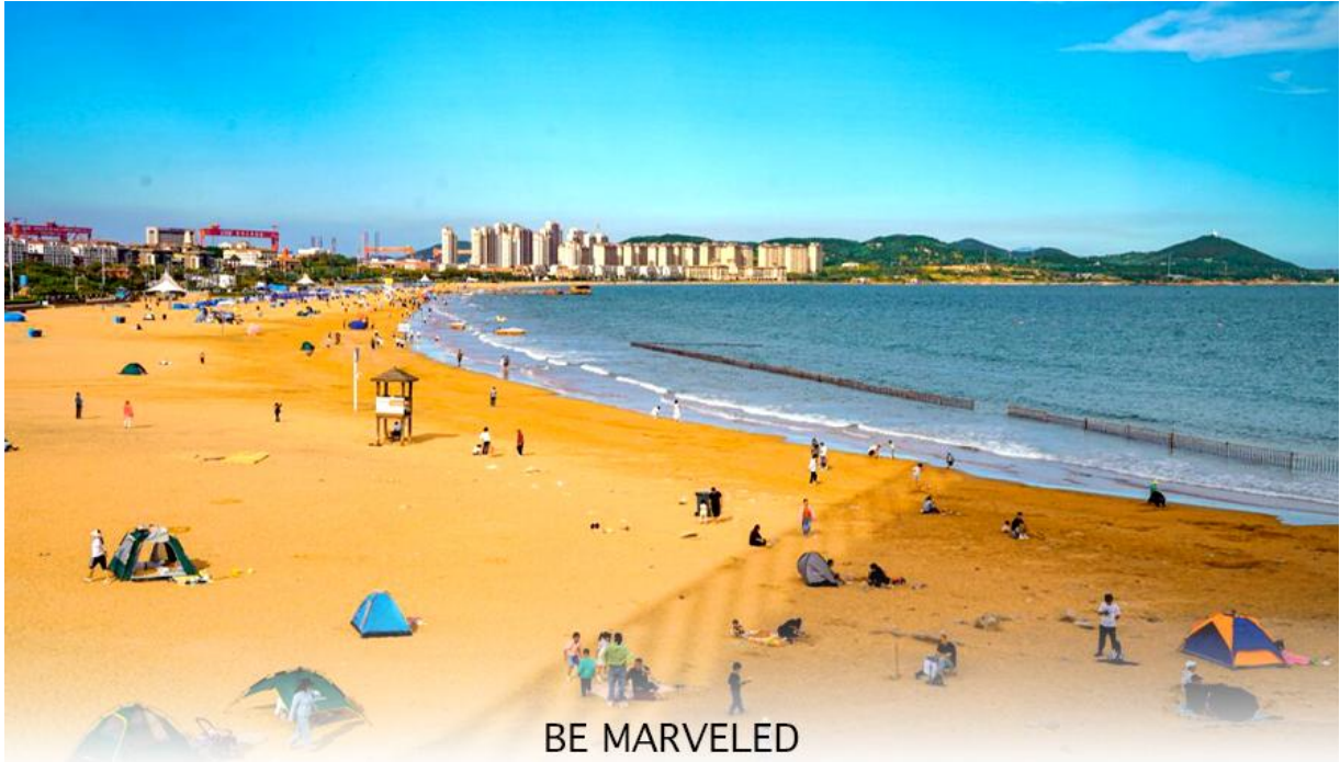
BE MARVELED หาดจินซาตาน

และชม หาดจินซาตาน ตั้งอยู่ในเขตหวงเต่า ของเมืองชิงเต่า มณฑลซานตง เป็นชายหาดที่ใหญ่ที่สุดและสวยที่สุดแห่งหนึ่งในเมืองชิงเต่า มีชื่อเสียงจากเม็ดทรายที่ละเอียดและมีสีเหลืองทองระยิบระยับ น้ำทะเลใสสะอาดและมีกิจกรรมหลากหลาย เช่น ว่ายน้ำ วอลเลย์บอลชายหาด และเครื่องเล่นทางน้ำ มีการจัดเทศกาลวัฒนธรรมและการท่องเที่ยวหาดทรายทองเป็นประจำทุกปีในช่วงฤดูร้อน