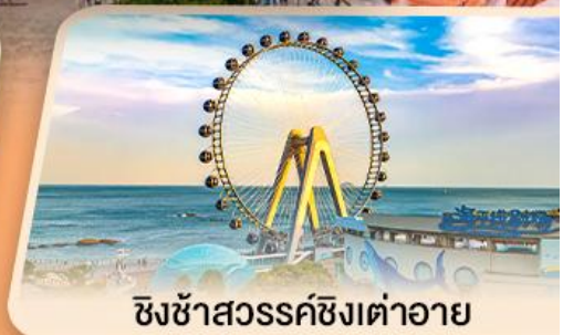
ชิงช้าสวรรค์ซิงต้าอาย