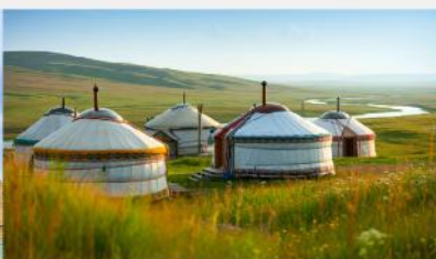
ที่พักแบบกระโจม