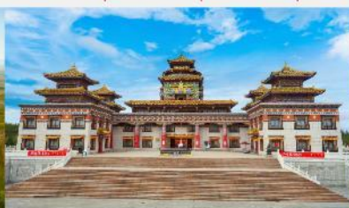
ทำเนียบพระลามะอุหลาน