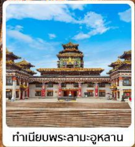
ทำเนียบพระลามะอุหลาน