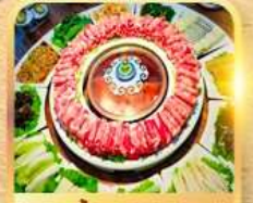
สุกีสโตลมองโก