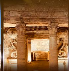
สุสานใต้ดินอเล็กซานเดรีย