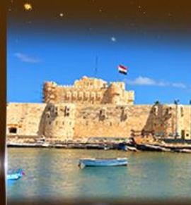
ป้อมปราการ Quite Bay