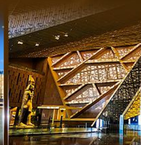
พิพิธภัณฑ์ไทรนิตี้อียิปต์ (GEM)