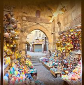
ตลาดงานอเล็กซานเดรีย