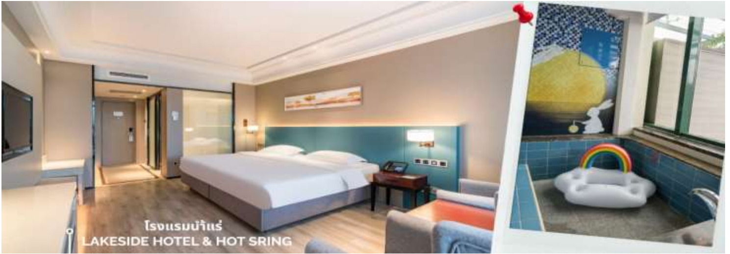
โรงแรมน้ำแร่ LAKESIDE HOTEL & HOT SPRING