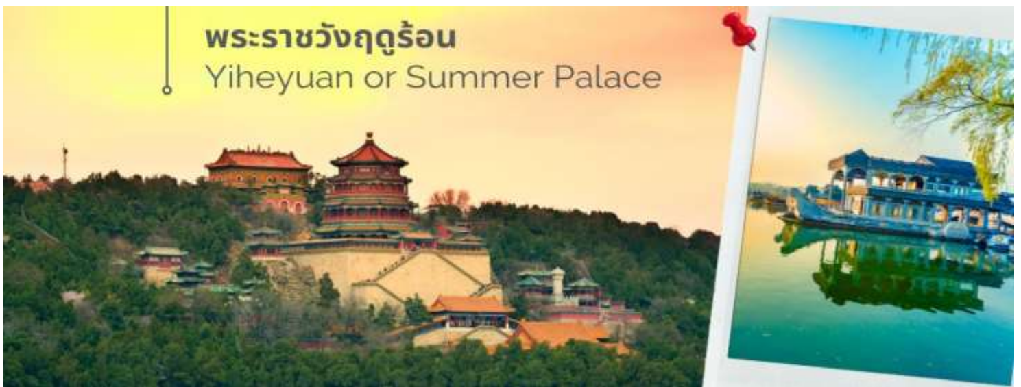
พระราชวังฤดูร้อน Yiheyuan or Summer Palace

วันที่สี่ พระราชวังฤดูร้อน - ร้านอาหาร - ร้านกาแฟร้านสวย - ถนนโบราณเฉียนเหมิน