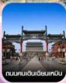
ถนนคนเดินเฉียนเหมิน

✈️ คอนเฟิร์มออกเดินทาง ทุกพีเรียด 2 ท่านขึ้นไป