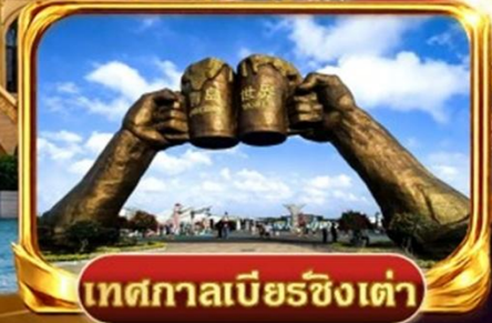
เทศกาลเบียร์ชิงเต่า