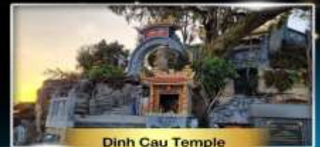
Dinh Cau Temple