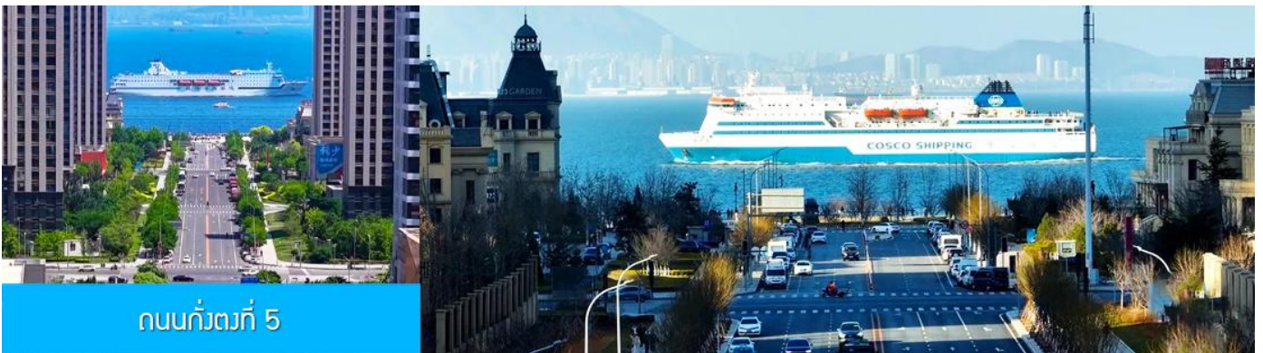
ถนนกั๋วตง 5