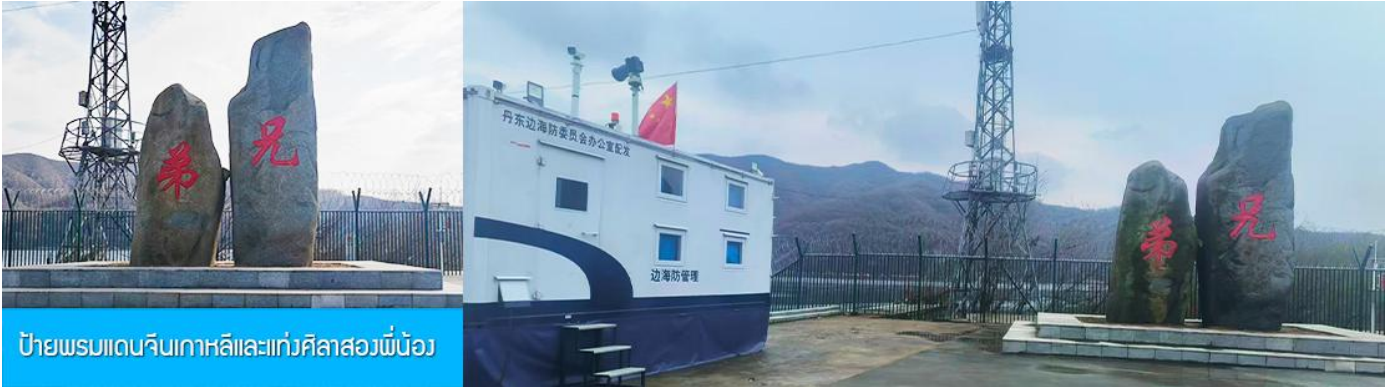
ป้ายพรมแดนจีนเกาหลีและแท่งศิลาสองพี่น้อง