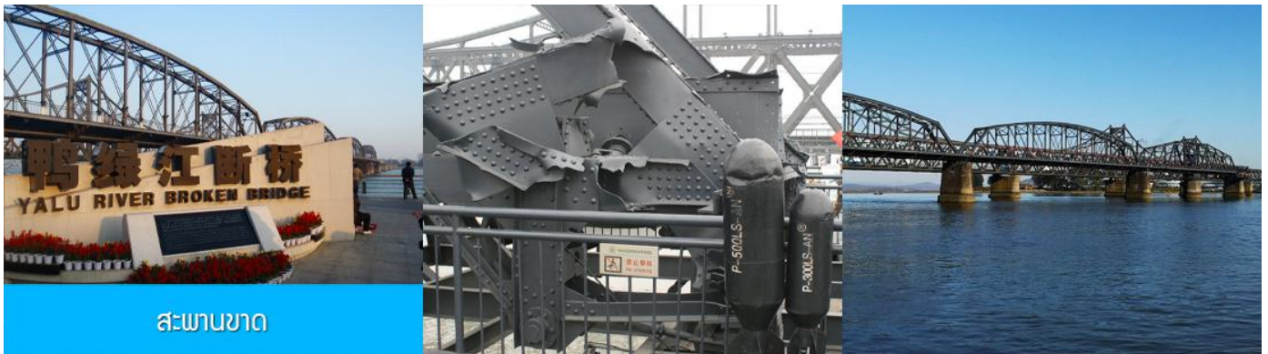
สะพานขาด