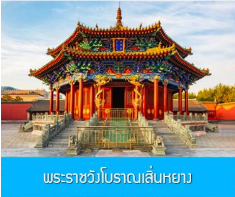
พระราชวังโบราณเสิ่นหยาง

รับประทานอาหารเช้า ณ ห้องอาหารของโรงแรม (1)