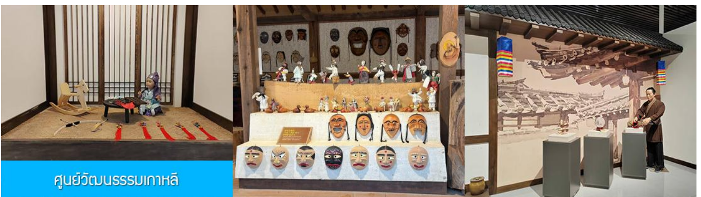
ศูนย์วัฒนธรรมเกาหลี

เช้า รับประทานอาหารเช้า ณ ห้องอาหารของโรงแรม (9)