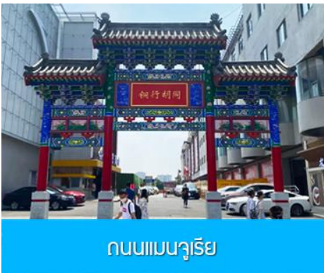
ถนนแมนจูเรีย