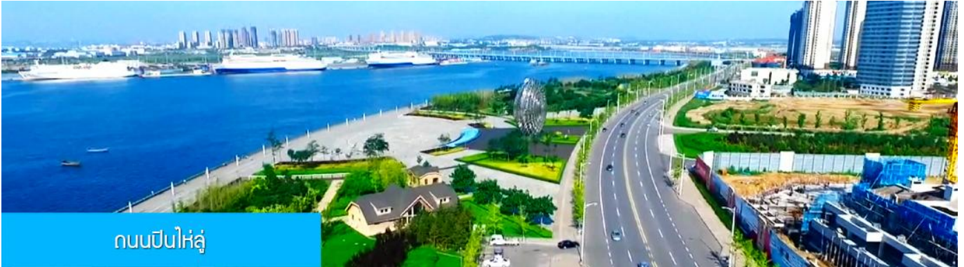
ถนนปินไห่หลู่

ล้อมด้วยตึกระฟ้าที่ทันสมัย ภายในมีบ่อน้ำพุคนตรี ลานหญ้าขนาดใหญ่ และลานกว้างสำหรับจัดกิจกรรม กลางแจ้ง อาทิ เทศกาลเบียร์นานาชาติ การแข่งขันวิ่งมาราธอน งานแฟชั่นนานาชาติเมืองต้าเหลียน ฯลฯ