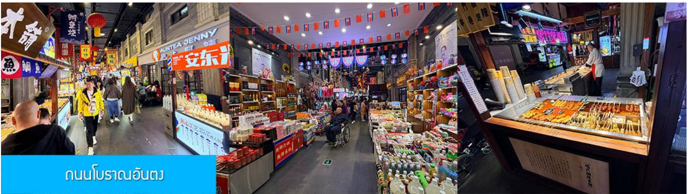
ถนนโบราณอันตง

จากนั้นนำท่านเที่ยวชม ถนนโบราณอันตง 安东老街 ถนนโบราณนี้มีชื่อเสียงในฐานะเป็นย่านการค้าที่คึกคักที่สุดในใจกลางเมืองอันตง (ภายหลังได้เปลี่ยนชื่อเป็นต้นตง) ในปีค.ศ. 1876 ในสมัยราชวงศ์ชิง ปัจจุบันถนนสายนี้ยังคงไว้ซึ่งอาคารบ้านเรือนยุคเก่า(ราชวงศ์ชิง) และอบอวลด้วยวัฒนธรรมพื้นเมืองโบราณ ท่านจะได้สัมผัสการละเล่นและการแสดงพื้นเมือง ร้านค้าจำหน่ายของที่ระลึก ร้านอาหารท้องถิ่น และสตรีทฟู้ด ฯลฯ