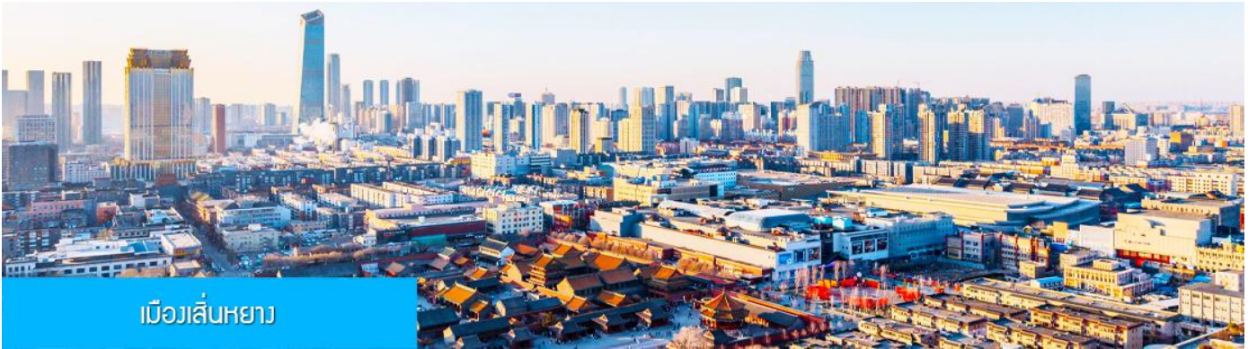
เมืองเสิ่นหยาง