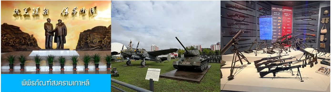
พิพิธภัณฑ์สงครามเกาหลี