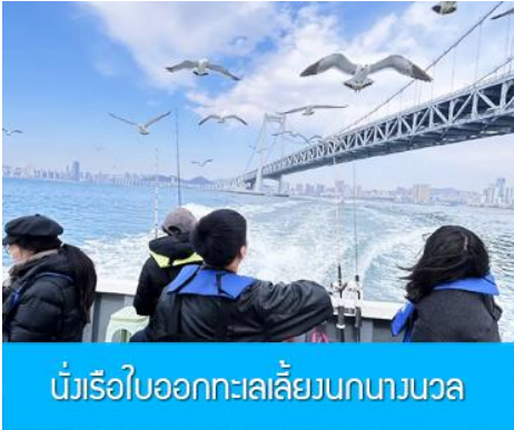
นั่งเรือใบออกทะเลลิยงกนางนวล

ต่อด้วยนำท่านเที่ยวชมถนนรัสเซีย 俄罗斯风情街 ในอดีตที่นี่เป็นศูนย์ที่ตั้งของที่ทำการเมืองต้าเหลียน ภายหลังได้กลายเป็นชุมชนของพ่อค้าและวิศวกรทางรถไฟชาวรัสเซีย บริเวณนี้จึงเต็มไปด้วยอาคารบ้านเรือนแบบตะวันตก(รัสเซีย) มากมาย นอกจากนี้ได้เก็บภาพที่มีพื้นหลังเป็นอาคารสถาปัตยกรรมตะวันตก ที่นี้ยังมีร้านค้าที่จำหน่ายสินค้าและของที่ระลึกที่นำเข้ามาจากรัสเซีย อาทิ ช็อกโกแลต เหล้าวอดก้า ตุ๊กตารัสเซีย ฯลฯ