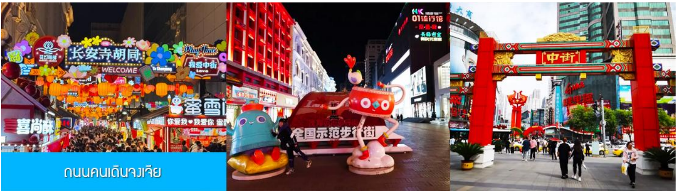
ถนนคนเดินวางเวีย