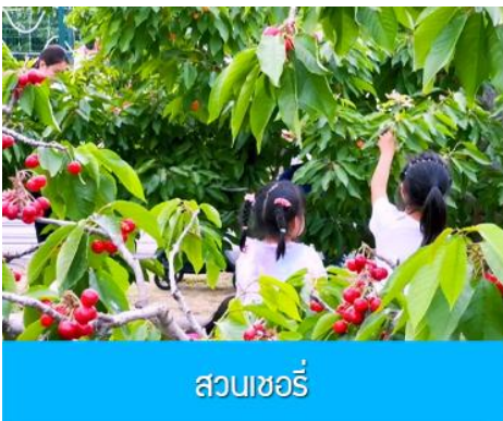
สวนชอร์รี่

หลังอาหารเช้า โดยรถบัสสู่ เมืองตันตง 丹东 (ระยะทาง 300 กม. ใช้เวลาเดินทางโดยรถบัส ประมาณ 3 ชั่วโมงครึ่ง)