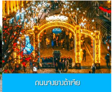
ถนนยาวต้าเจีย