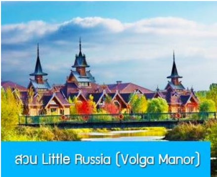
สวน Little Russia (Volga Manor)