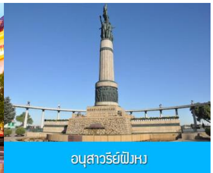
อนุสาวรีย์พิงหว