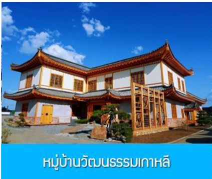
หมู่บ้านวัฒนธรรมเกาหลี

จากนั้นนำท่านเดินทางสู่เมืองตุนฮว่า 敦化 (ระยะทาง 130 กม. ใช้เวลาเดินทางราว 2 ชั่วโมง)