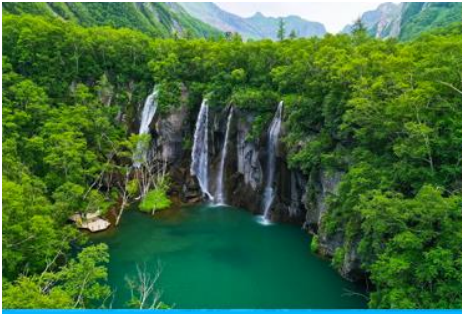
สระน้ำรกต