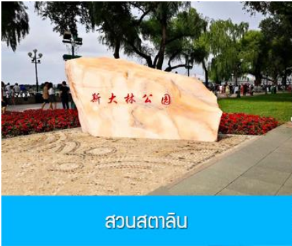
สวนสตาลิน