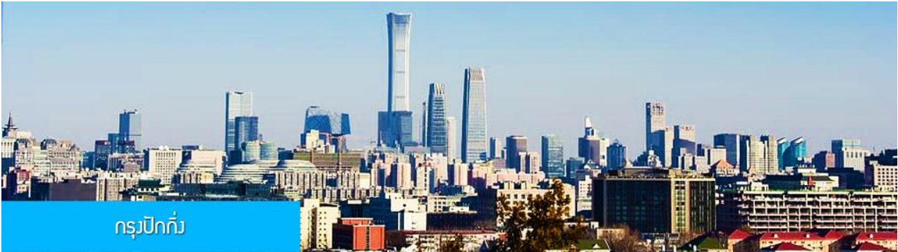
กรุงปักกิ่ง