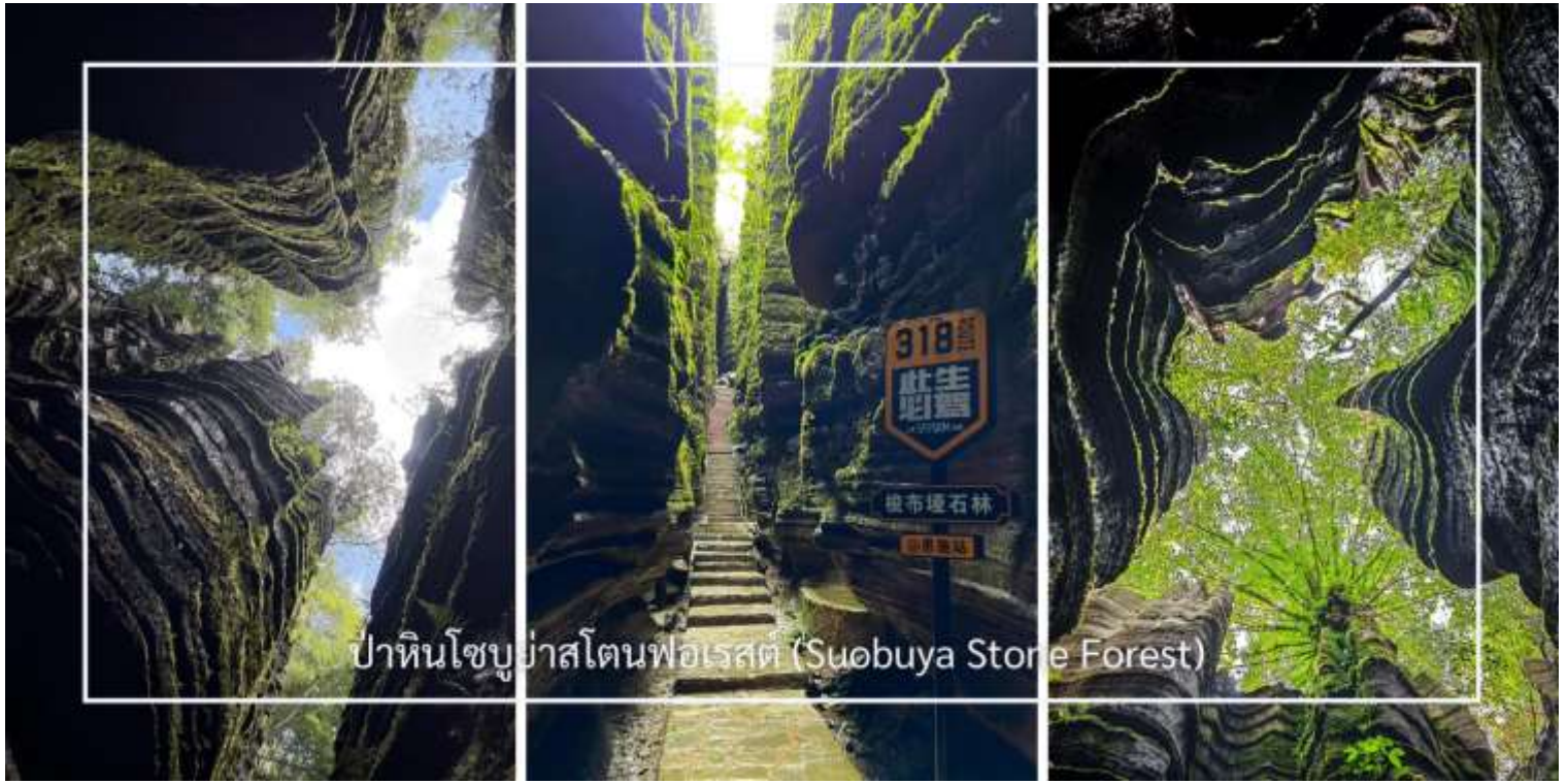
ป่าหินโซบูยา สโตนฟอเรสต์ (Suobuya Stone Forest)

สมควรแก่เวลานำท่านเดินทางกลับอู่ซาง (ใช้เวลาประมาณ3ชั่วโมง)