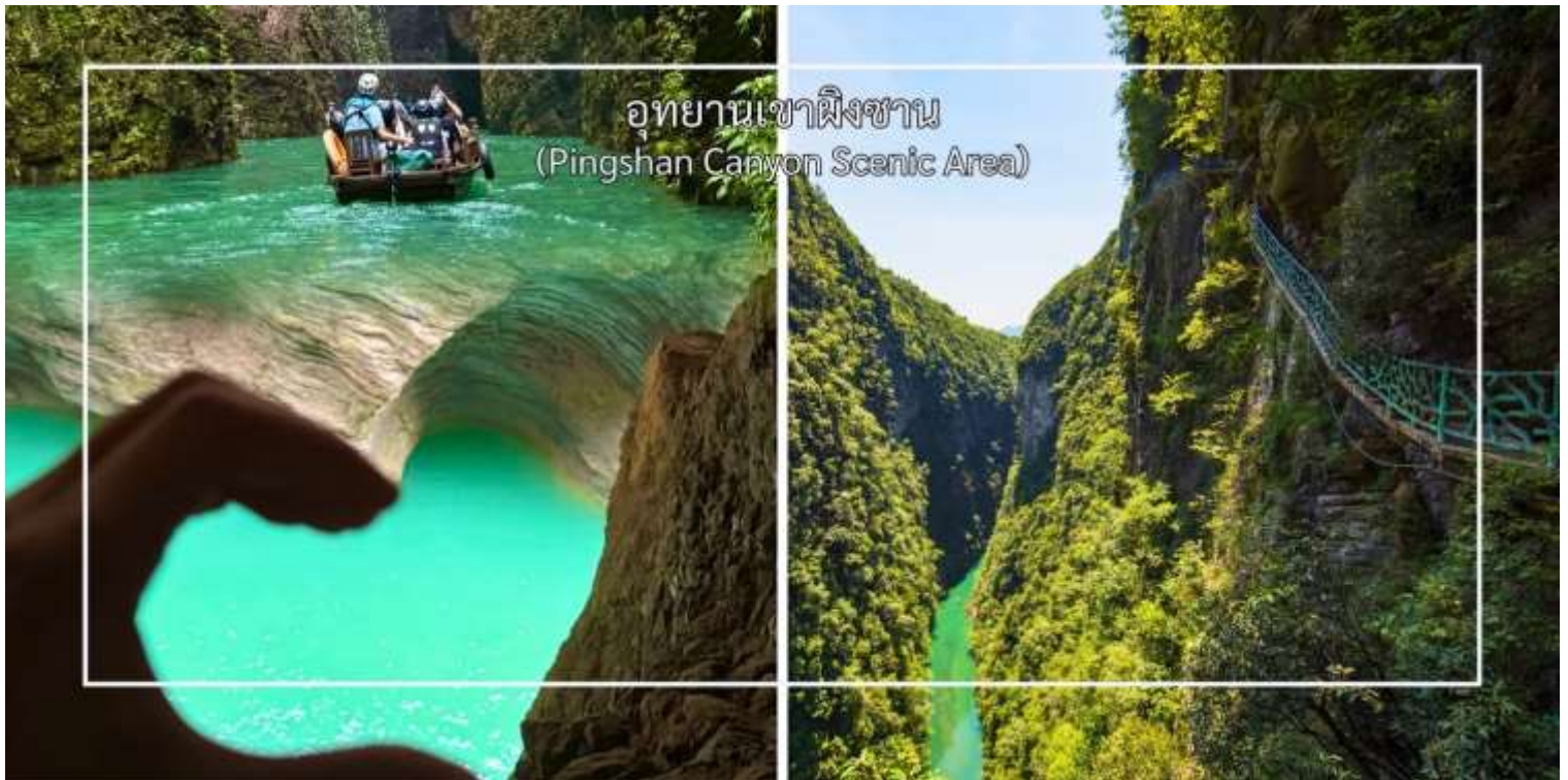
อุทยานเขาผิงซาน (Pingshan Canyon Scenic Area)

นำท่านสัมผัสความยิ่งใหญ่ที่เที่ยวระดับ 4A ที่ อุทยานเขาผิงซาน(Pingshan Canyon Scenic Area) (รวมล่องเรือ) หรือที่รู้จักในชื่อ โกรกรูปหัวใจ (Heart-Shaped Gorge) หนึ่งในแลนด์มาร์กธรรมชาติที่สวยงามและมีเอกลักษณ์สวยงาม ด้วยรูปทรงโกรกที่คล้ายหัวใจซึ่งเกิดจากการกัดเซาะของสายน้ำและกระบวนการทางธรณีวิทยามายาวนาน ทำให้กลายเป็นจุดชมวิวที่โรแมนติกและเหมาะแก่การถ่ายภาพ ท่านสามารถเดินชมเส้นทางธรรมชาติรอบโกรก หรือมองจากจุดชมวิวสูงเพื่อเห็นภาพโกรกรูปหัวใจอย่างเต็มตา นอกจากความสวยงามแล้ว บริเวณนี้ยังเต็มไปด้วยธรรมชาติอันอุดมสมบูรณ์ ทั้งป่าไม้ ลำธาร และสัตว์ป่าที่อาศัยอยู่ในพื้นที่ ทำให้เป็นจุดหมายที่ผสมผสานทั้งความงดงามและความสงบแห่งธรรมชาติ