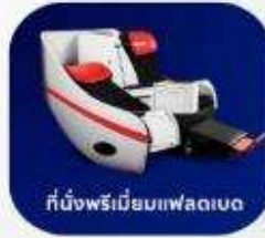
ที่นั่งพรีเมียมแฟลตเบด