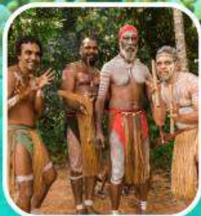
Rainforestation Aboriginal Show