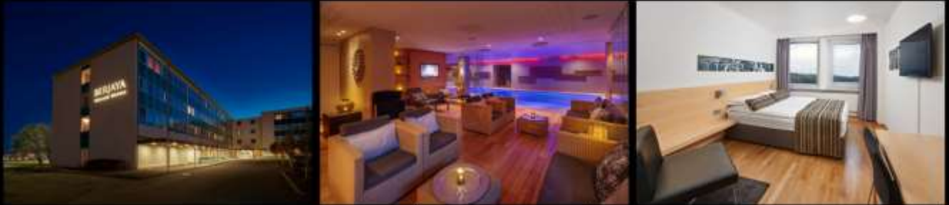
***รูปภาพเพื่อประกอบการโฆษณาเท่านั้น***