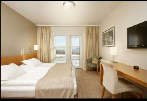
***รูปภาพเพื่อประกอบการโฆษณาเท่านั้น***