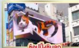
ซูปปิ้งชินจูกุ