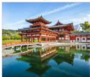
วัดเมี่ยวโตจิมและ ถนนชาเจียว