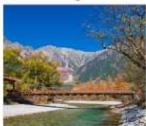
ดามิโดจิ