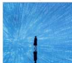
ทีมแล็บแพคนเน็ต