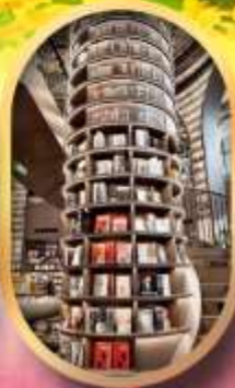
อุทยานปีศาจโกว