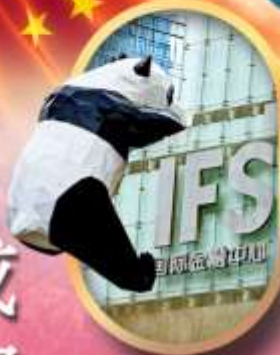
IFS หมีแพนด้าปิ่นด๊ก