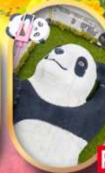
หมีแพนด้าเซลฟี