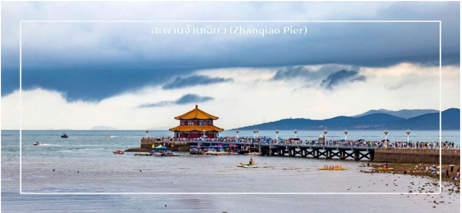
สะพานฉานเจียว (Zhanqiao Pier)