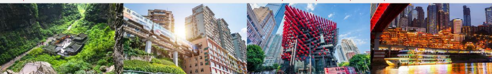
อุทยานแห่งชาติหลุมฟ้า 3 สะพานสวรรค์ รถไฟฟ้ากะลุดึก ตึกตะเกียบ หงหยาดัง