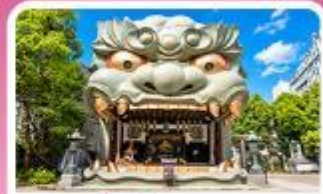
ศาลเจ้านิมมะ ยาชากะ