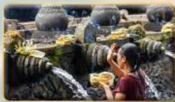
วัดน้ำพุศักดิ์สิทธิ์