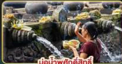
บ่อน้ำพุศักดิ์สิทธิ์