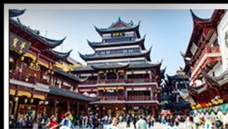
ตลาดร้อยปีเฉิงหวงเหมียว