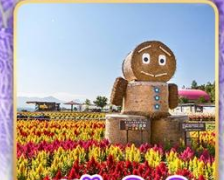
สวนซึกิไซโนะโอะกะ