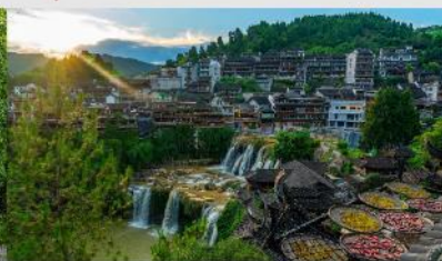
หมู่บ้านโบราณฝูหรงเจิน

*ทางบริษัทฯ ขอสงวนสิทธิ์ในการสลับโปรแกรมทัวร์ตามความเหมาะสมขึ้นอยู่กับสถานการณ์หน้างาน โดยคำนึงถึงผลประโยชน์ของลูกค้าเป็นสำคัญ