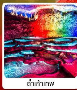
ถ้ำเก้าเทพ

ไฮไลท์! หมู่บ้านซานเสี่ยเหรินเจีย หมู่บ้านโบราณฟูหรงเจิ้น ถ้ำเก้าเทพ ล่องเรือทะเลสาบผิงหู สวนถ้ำสามสหาย