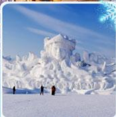
งานแกะสลัก เกาะพระอาทิตย์