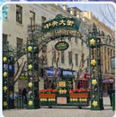
ถนนจงยาง