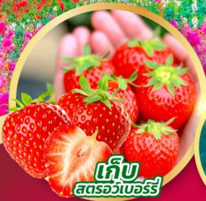
เก็บ สตรอว์เบอร์รี่