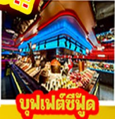
บุฟเฟ่ต์ซีฟู้ด