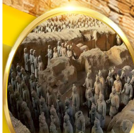
สุสานทหาร ดินเผาจีนซี