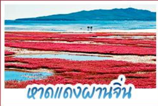
หาดแดงผานจีน