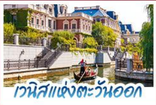
เวนิสแห่งตะวันออก